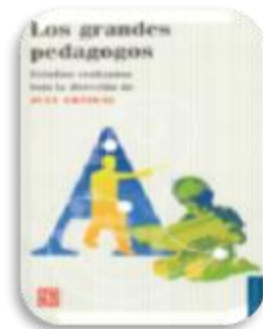
Château, Jean. Los grandes pedagogos. México : Fondo de Cultura Económica, 2013.