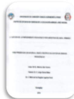
Diaz, Maximo. La gestión del acompañamiento pedagógico para maestros del nivel primario. Camagüey : 2018.

C/ Furcy Pichardo No. 4, Ensanche Bella Vista, D.N. República Dominicana