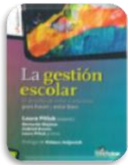
Pitluk, Laura. La gestión escolar. Rosario, Argentina : Homo Sapiens Ediciones, 2016.