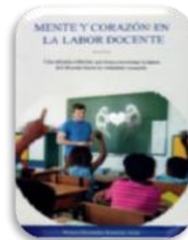
Ramírez, Wilson. Mente y corazón en la labor docente. San Cristobal : Alfa D´ Sing, 2019.