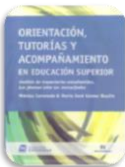
Coronado, Mónica. Orientación, tutorías y acompañamiento en educación superior: Análisis de trayectorias estudiantiles. Buenos Aires : Noveduc, 2015.