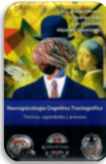
Dávalos, Julián. Neuropsicología cognitiva tractográfica : Técnicas, capacidades y procesos. Córdoba : Brujas, 2011.