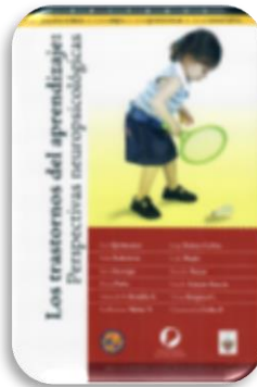
Los Trastornos del aprendizaje : Perspectivas neuropsicológicas. Bogotá : Magisterio, 2008.